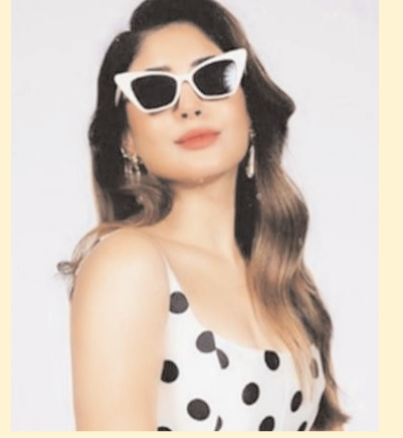
योगदान दिखाया गया है, जो उस समय शहर की अर्थव्यवस्था का बड़ा हिस्सा थीं। यह शो प्राइम वीडियो पर 17 अप्रैल को रिलीज होने जा रहा है।

आज जैसे नहीं थे। उस समय कॉल जोड़ने के लिए ऑपरेटर होते थे, जो मैनुअली लाइनों को कनेक्ट करते थे। उन्होंने कहा, आज की नई पीढ़ी शायद इन चीजों से पूरी तरह अनजान है, क्योंकि अब तकनीक काफी आगे बढ़ चुकी है। एक्ट्रेस के कहा, उस दौर की कई बातें मेरे लिए काफी रोचक थीं। भले ही समय बदल गया हो, लेकिन लोगों की भावनाएं और उम्मीदें आज भी वैसी ही हैं। इंसान हमेशा उम्मीद से जुड़ा रहता है, और यही भावना इस शो में भी देखने को मिलती है। इसी वजह से मैं अपने किरदार और कहानी से आसानी से जुड़ पाई। मटका किंग की कहानी एक ऐसे शख्स के इर्द-गिर्द घूमती है जो जुए की दुनिया में तेजी से आगे बढ़ता है और उस समय की मुंबई में अपनी पहचान बनाता है। इस कहानी में उस दौर की कपड़ा मिलों का भी अहम